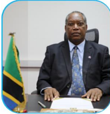
Mhe. Prof. Palamagamba J. A. M. Kabudi (Mb), WAZIRI