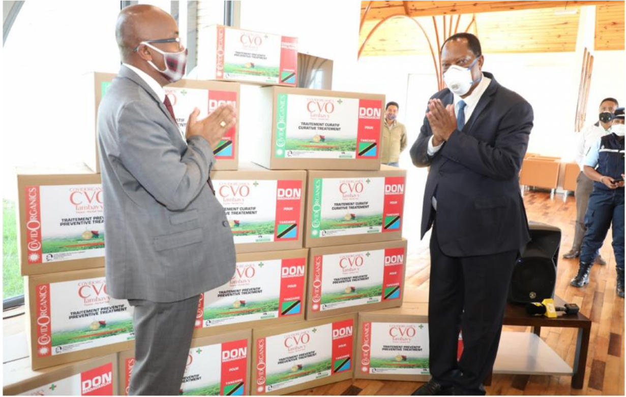
Mhe. Prof. Palamagamba J.A.M Kabudi (Mb), Waziri wa Mambo ya Nje na Ushirikiano wa Afrika Mashariki akimshukuru Mhe.Tehindrazanarivelo Djacoba A.S Oliva, Waziri wa Mambo ya Nje wa Madagascar baada ya kukabidhiwa zawadi ya dawa ya Homa Kali ya Mapafu inayosababishwa na virusi vya corona (COVID-19).