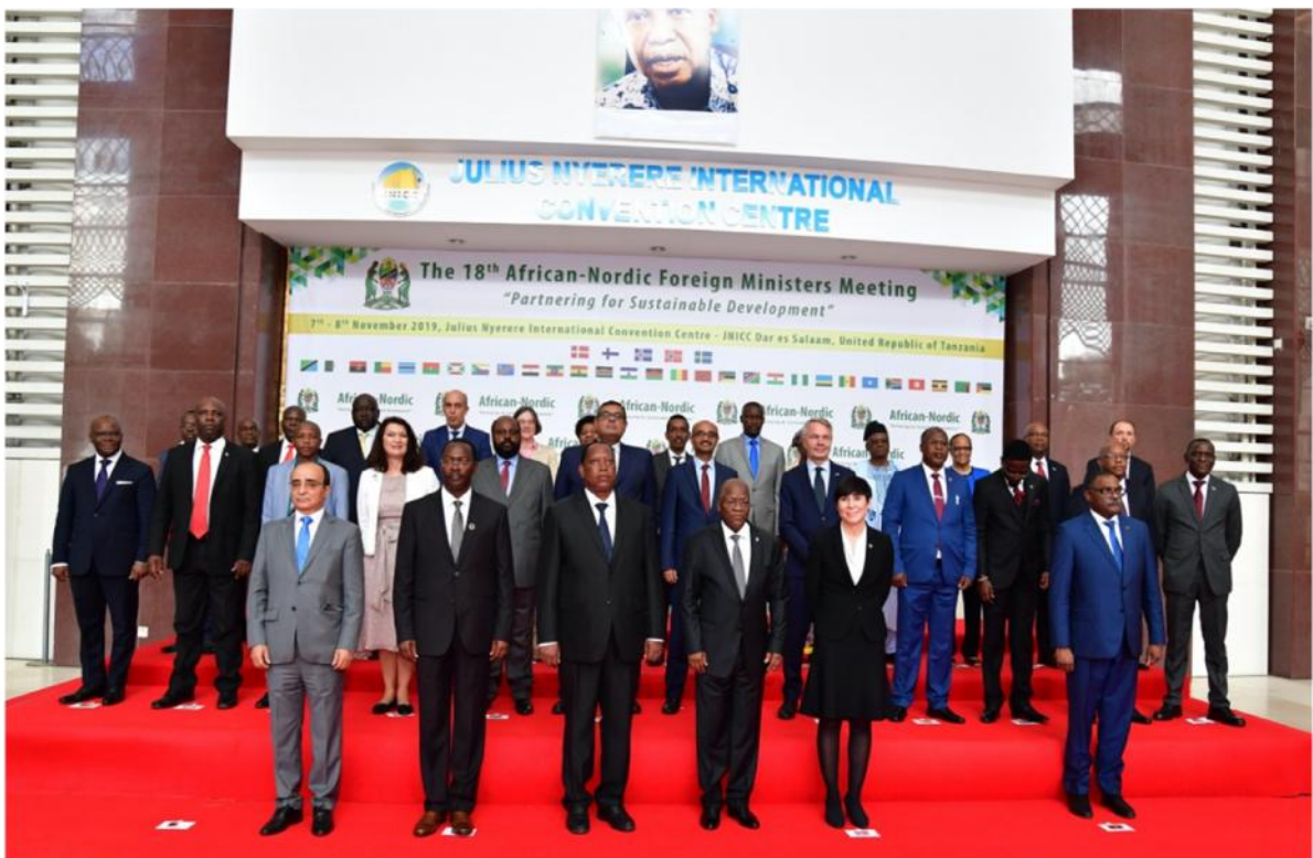
Rais wa Jamhuri ya Muungano wa Tanzania Mheshimiwa Dkt. John Pombe Joseph Magufuli, akiwa katika picha ya pamoja na Mawaziri wa Mambo ya Nje wa nchi za Afrika na Nordic mara baada ya Mkutano wao uliofanyika katika ukumbi wa Julius Nyerere International Convention Centre (JNICC) jijini Dar es Salaam mwezi Novemba 2019.