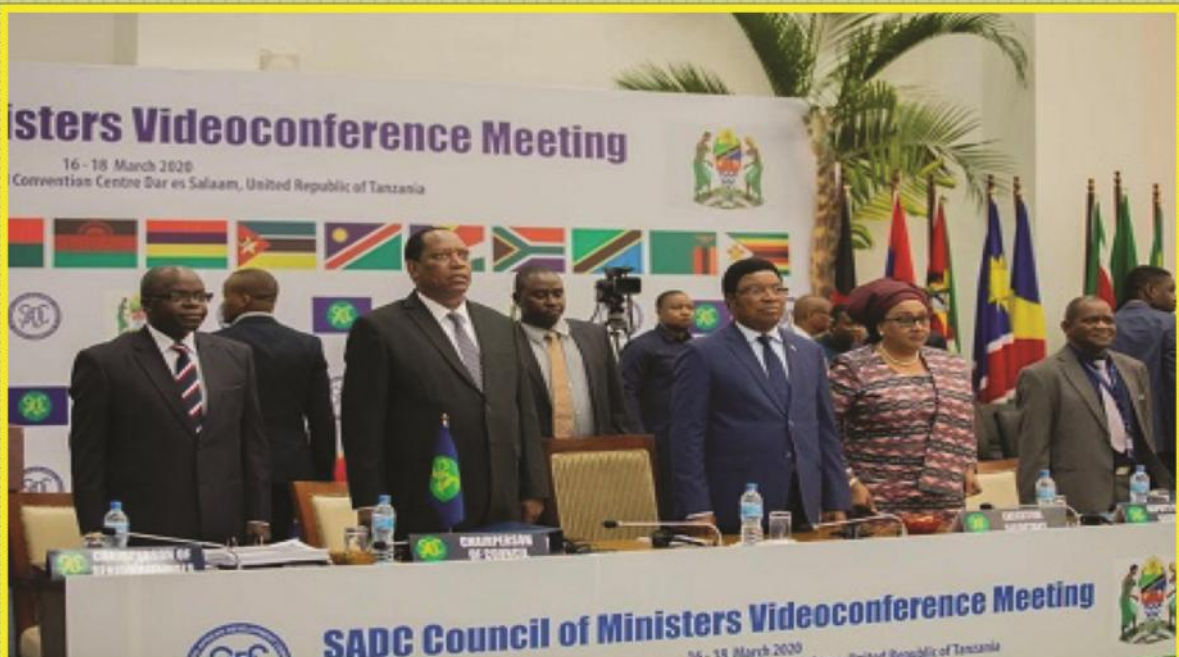
Mheshimiwa Kassim M. Majaliwa (Mb), Waziri Mkuu wa Jamhuri ya Muungano wa Tanzania wakati wa ufunguzi wa Mkutano wa Baraza la Mawaziri wa Jumuiya ya Maendeleo Kusini mwa Afrika uliofanyika kwa njia ya video mwezi Machi 2020.