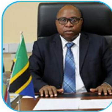
Mhe. Dkt. Damas D. Ndumbaro (Mb), NAIBU WAZIRI