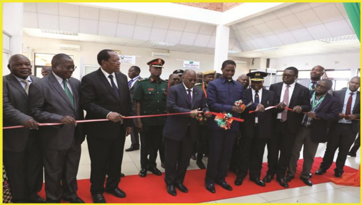
Mheshimiwa Dkt. John Pombe Joseph Magufuli, Rais wa Jamhuri ya Muungano wa Tanzania na Mheshimiwa Edgar Chagwa Lungu, Rais wa Jamhuri ya Zambia wakikata utepe kwenye uzinduzi wa Kituo cha Huduma kwa Pamoja Mpakani (OSBP) Tunduma/Nakonde mwezi Oktoba, 2019.